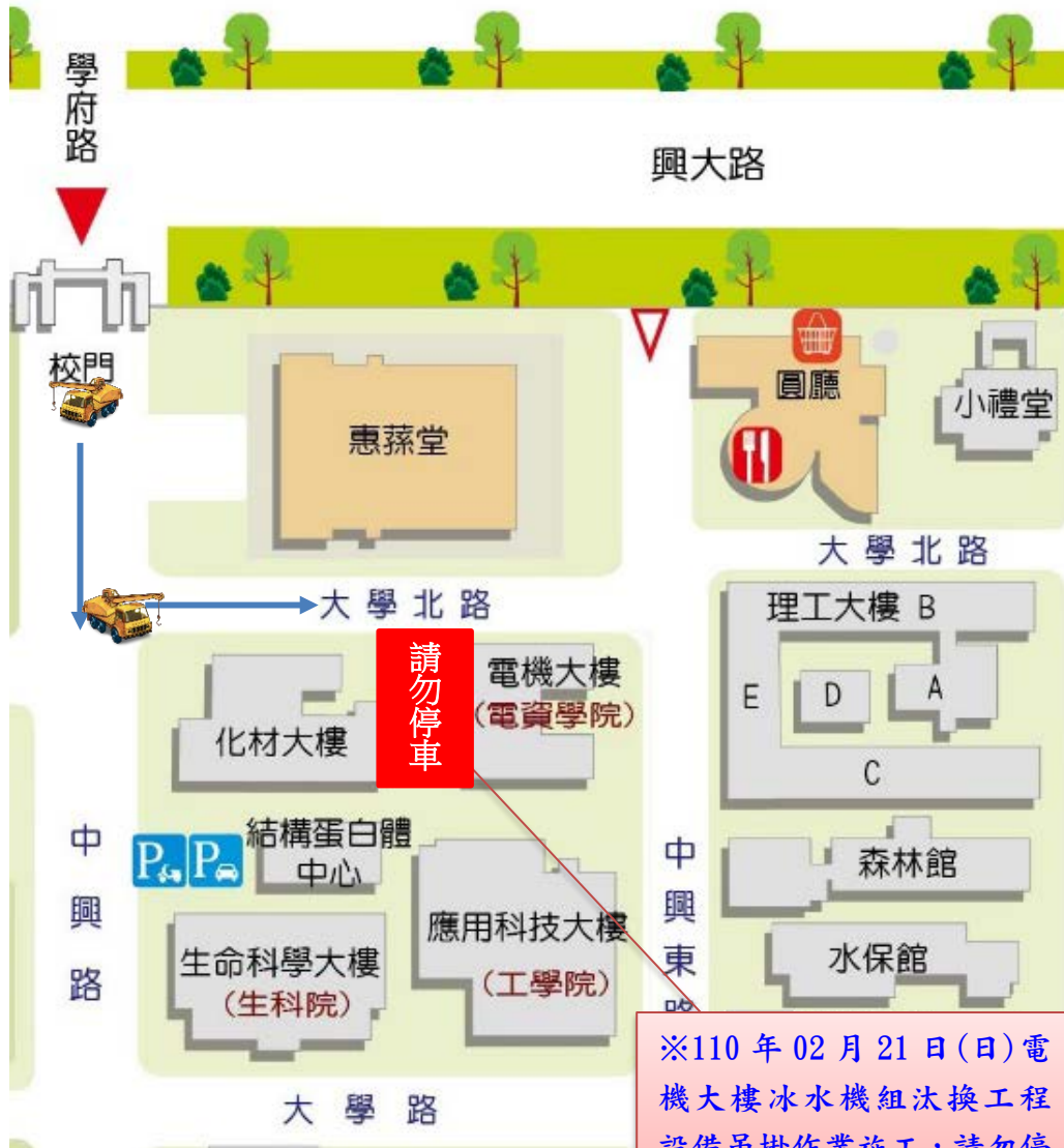
【電機大樓吊掛施工位置地現況】

※110年02月21日(日)電機大樓冰水機組汰換工程設備吊掛作業施工，請勿停車※