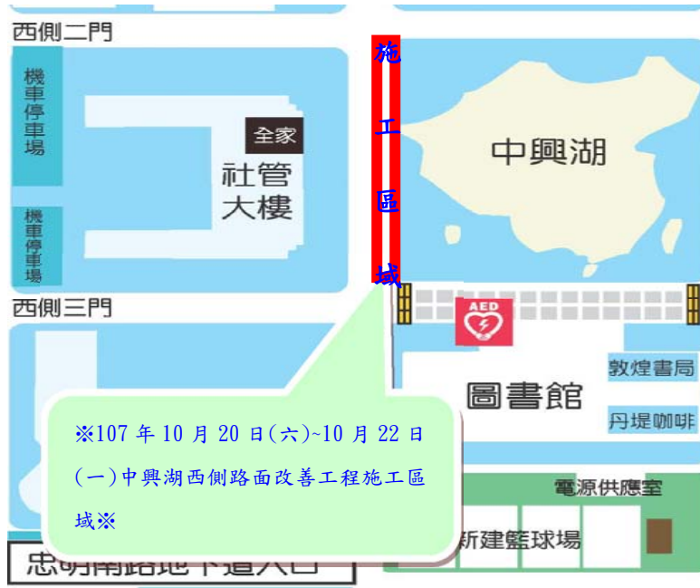
【中興湖西側施工位置示意圖】