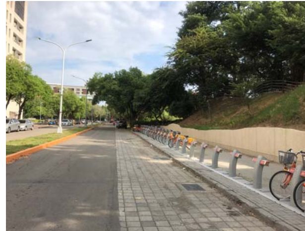
【中興湖西側現況照片-2】