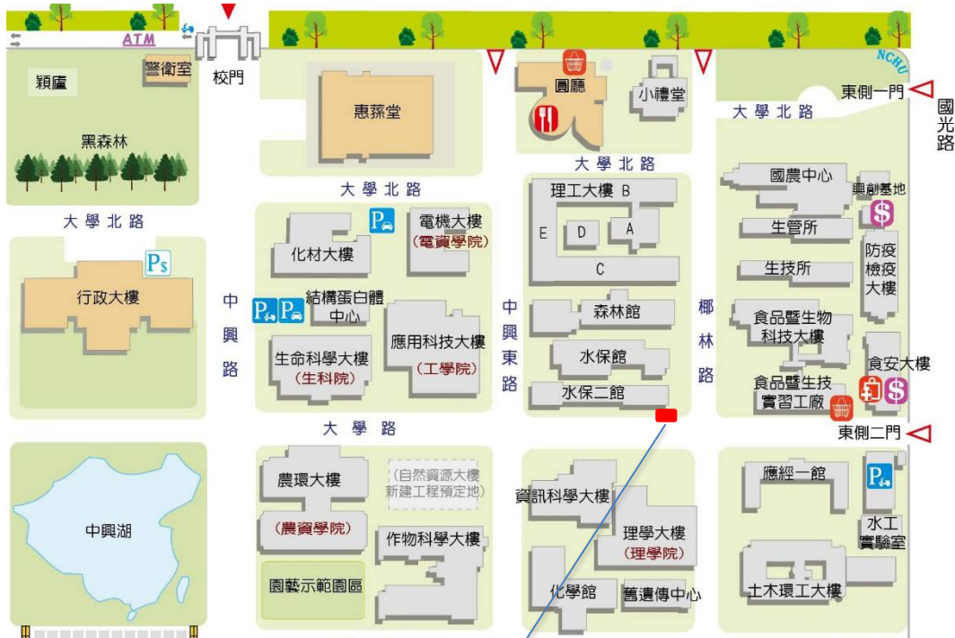
【水保二館南側地下水管線施工施工處示意圖】